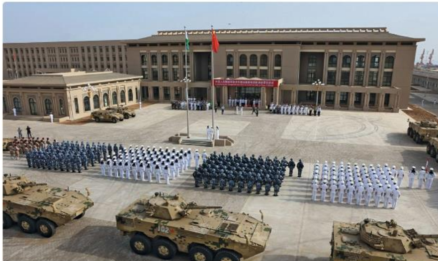
Djibouti accueille la seule base militaire permanente chinoise à l'étranger, concédée jusqu'en 2026.