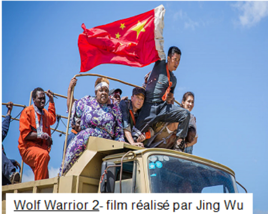
Wolf Warrior 2 - film réalisé par Jing Wu

Après s'être engagée dans de nombreux secteurs sur le continent africain, la Chine veut investir les salles obscures.