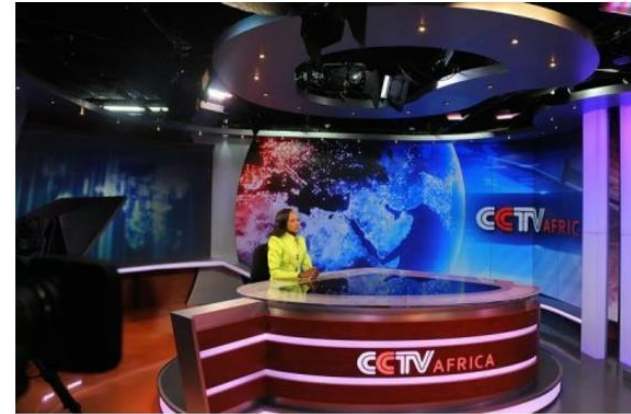
CCTV Africa, une chaîne chinoise à Nairobi pour aider les relations Sino-africaines

« La Chine mène depuis les années 2010 une stratégie d'expansion de ses médias sur le continent africain. Un moyen d'affirmer l'image du pays (..) mais aussi d'affirmer sa présence et sa puissance aux yeux de la communauté internationale (..). Pékin y a déployé depuis une dizaine d'année ses groupes médiatiques (Radio Chine Internationale (RCI), la télévision avec CGTN Afrique ou la presse avec China Daily). Une manière de mieux établir son influence auprès des décideurs et opinions publiques, mais aussi d'entretenir une image favorable autour de son implantation ».