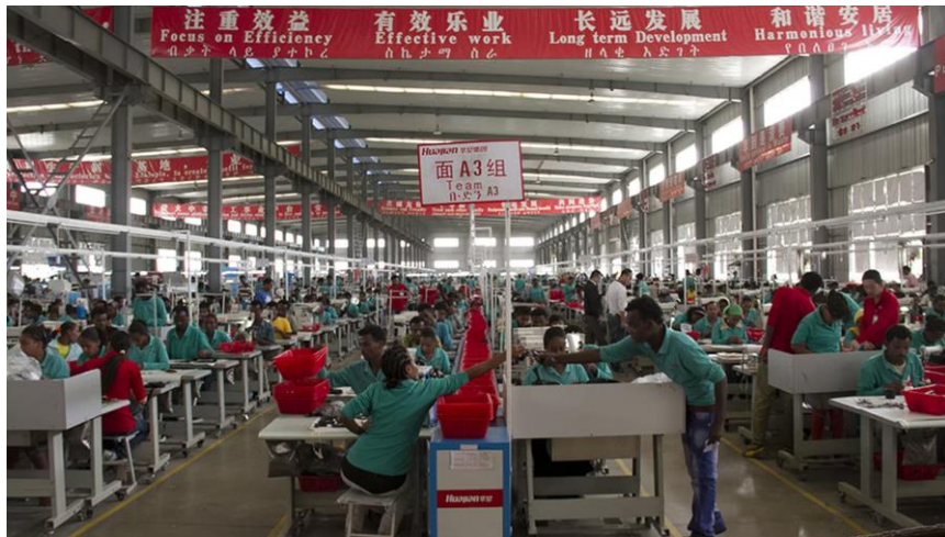
Document « L’Ethiopie nouvel eldorado de la chaussure » France info, 2014.

L’entreprise chinoise est venue chercher ici une main d’œuvre abondante et bon marché.